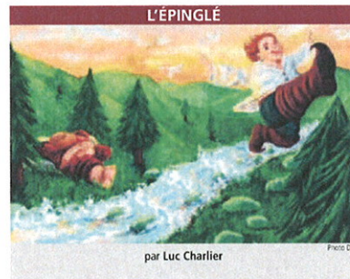
par Luc Charlier

Qui peut débloquer la situation ? Il faudrait que le marché soit convaincu que « l'on sait tout ce que l'on doit savoir » sur le portefeuille d'actifs des banques. Mais nous ne sommes sans doute pas encore au bout des dépréciations d'actifs. Globalement, on peut toutefois se féliciter de l'action des banques centrales qui ont parfaitement joué leur rôle de « pompiers » dans cette crise. Propos recueillis par Marc Lambrechts