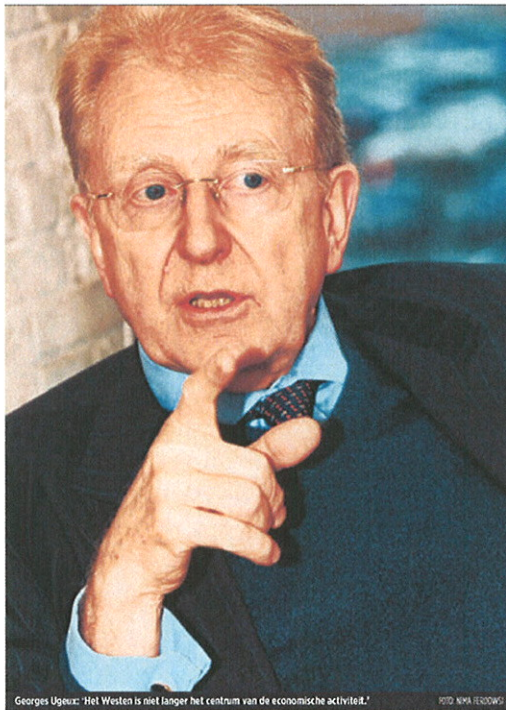
Georges Ugeux: 'Het Westen is niet langer het centrum van de economische activiteit.'

” Dik 300 miljard aan afschrijvingen door de banken betekent mogelijk 3.000 miljard dollar minder aan kredieten.